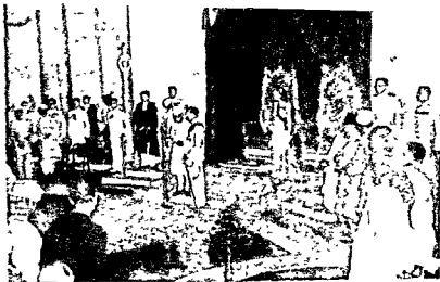
Taking the oath 14-8-1947 midnight ( Song 33 )